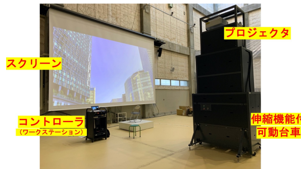
ID 609 飛行実験空間 シミュレータ用 VR システム リコージャパン