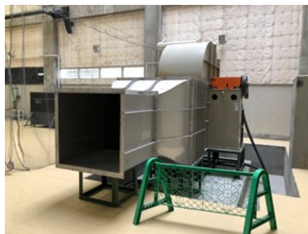
ID 607 定常流発生装置 正豊工学実験装置製作所