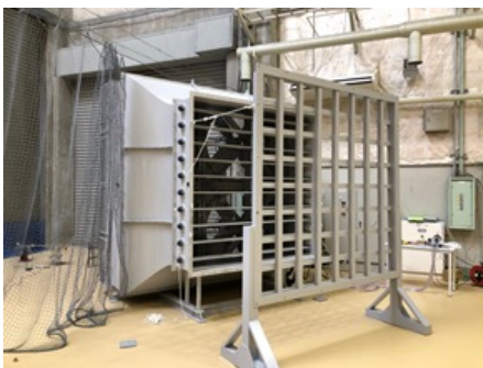
ID 606 非定常流・突風発生装置 西日本流体技研

「設備・機器検索&予約」>「専攻・研究部門」で「航空宇宙工学専攻」を選択して検索 使用規定 がございますので、利用をご検討の際は下記問い合わせ先までご連絡ください。